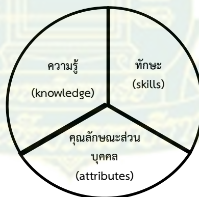
ภาพที่ 2.2 องค์ประกอบของสมรรถนะ

จากแนวคิดเกี่ยวกับสมรรถนะ (competency) ที่หลากหลายของนักวิชาการต่างๆ สรุปได้ว่าสมรรถนะประกอบไปด้วย 3 องค์ประกอบ ได้แก่ ความรู้ (knowledge) ทักษะ (skill) และคุณลักษณะส่วนบุคคล (personal characteristic or attributes) ที่ทำให้บุคคลผู้นั้นทำงานในบทบาทหน้าที่ ความรับผิดชอบของตนเองได้ดีกว่าผู้อื่น